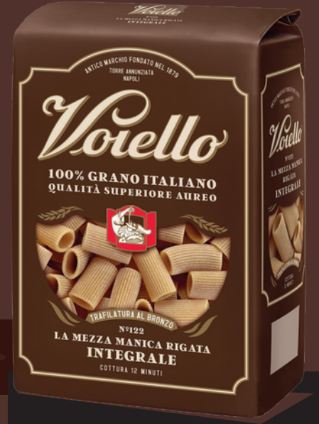
N° 122 LA MEZZA MANICA RIGATA INTEGRALE