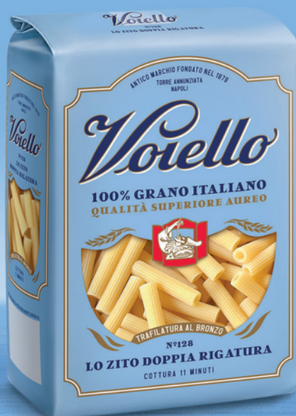
N° 128 IL ZITO DOPPIA RIGATURA