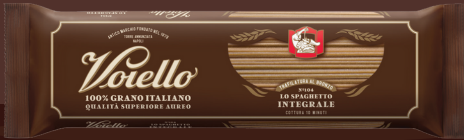
N° 104 LO SPAGHETTO INTEGRALE