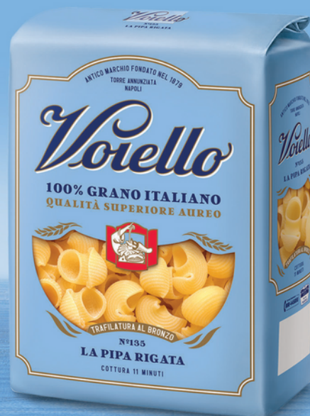
N° 135 LA PIPA RIGATA