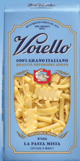
N° 126 LA PASTA MISTA