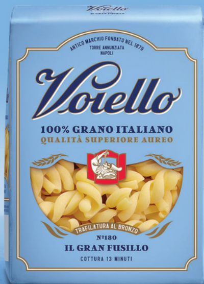
N° 180 IL GRAN FUSILLO