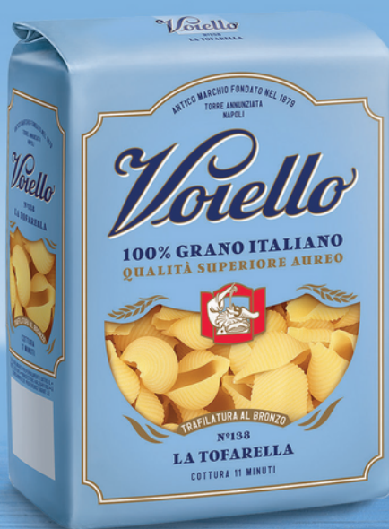
N° 138 LA TOFARELLA