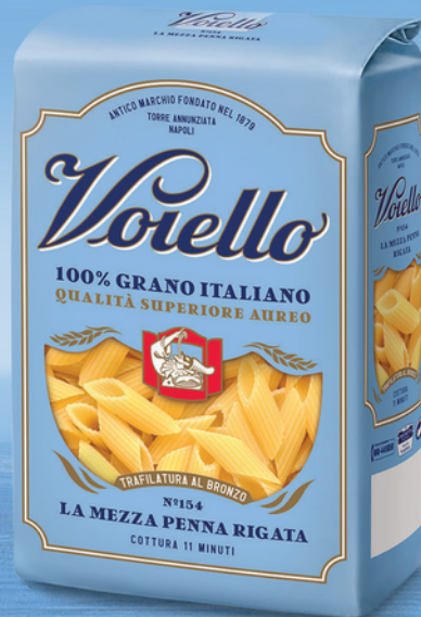
N° 154 LA MEZZA PENNA RIGATA