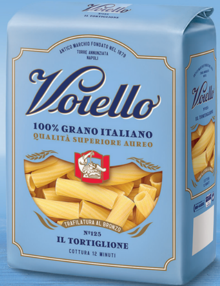
N° 125 IL TORTIGLIONE