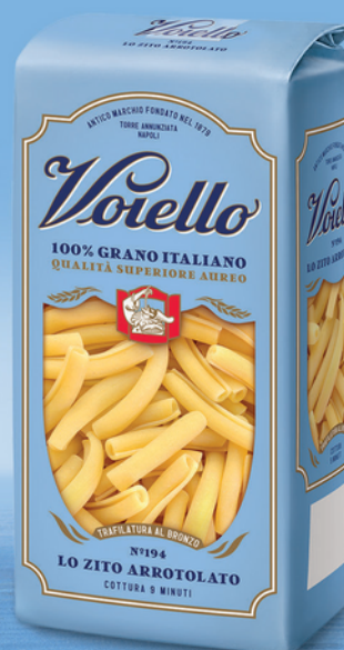
N° 194 IL ZITO ARROTOLATO