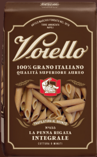
N° 155 LA PENNA RIGATA INTEGRALE