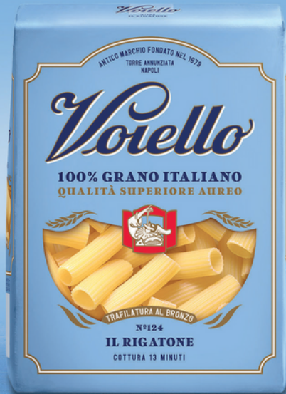
N° 124 IL RIGATONE