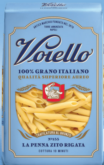
N° 155 LA PENNA ZITO RIGATA