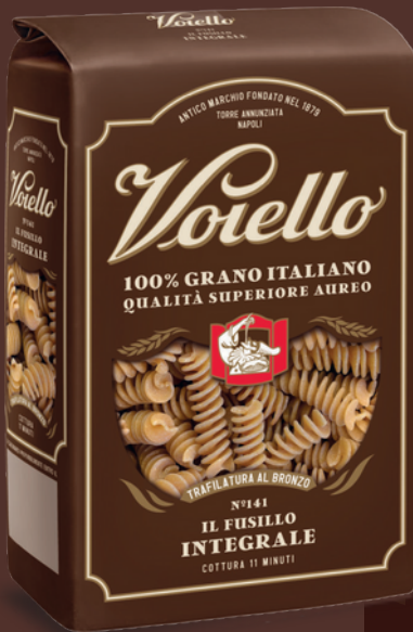
N° 141 IL FUSILLO INTEGRALE