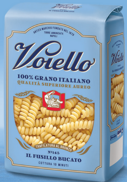
N° 145 IL FUSILLO BUCATO