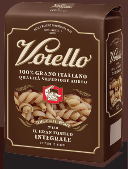
N° 180 IL GRAN FUSILLO INTEGRALE