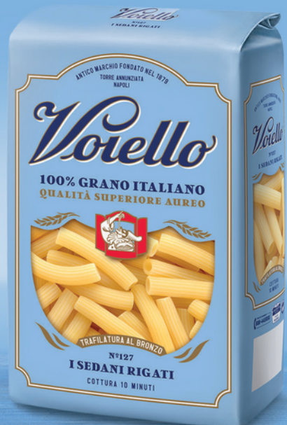
N° 127 I SEDANI RIGATI