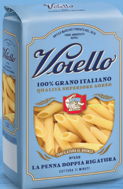
N° 152 LA PENNA DOPPIA RIGATURA