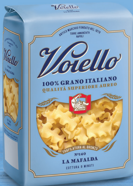
N° 140 LA MAFALDA