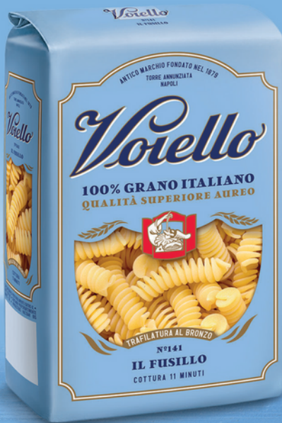
N° 141 IL FUSILLO