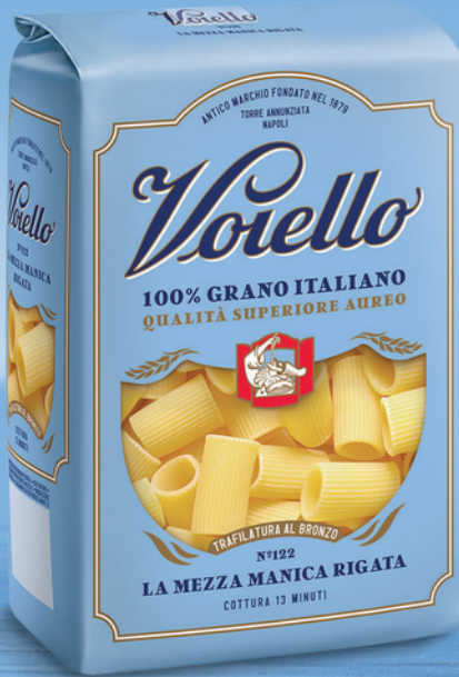
N° 122 LA MEZZA MANICA RIGATA