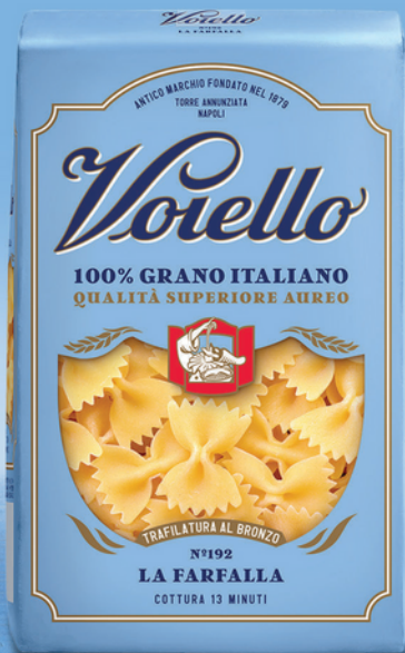
N° 192 LA FARFALLA